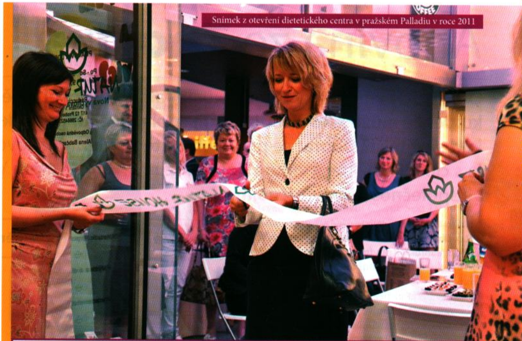
Snímek z otevření dietetického centra v pražském Palladiu v roce 2011

Obvyklá praxe totiž vypadá tak, že si lidé na Nový rok stanoví několik předsevzetí, ať již se týkají hubnutí, nebo odvykání kouření, a po několika málo týdnech od nich upouštějí. Nejčastější překážka spočívá v tom, že nemají dostatečnou motivaci a vůli vytrvat. Právě s těmito atributy v dietetických centrech NATURHOUSE pracujeme.