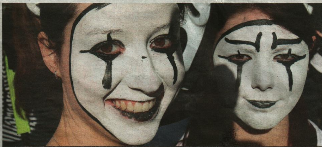
Studenti z hotelové školy ve Vršovcích si včera prožili svoje poslední zvonění. Po celé zemi začínají maturity.

Omezení. Doposud dopravní podnik vyznačoval prostor pro kočárky pouze v prvním a posledním vagonu. Opravdu kamkoli? Napříště budou moci matky s kočárky do kteréhokoli vozu, musí však dát pozor, zda nezabírají místo invalidům. Tady ne. Ti totiž kočárky na vyhrazených místech neradi vidí. STRANA 2