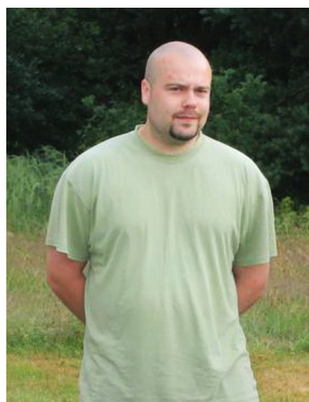
David Krejčí v době, kdy vážil 106,7 kg.